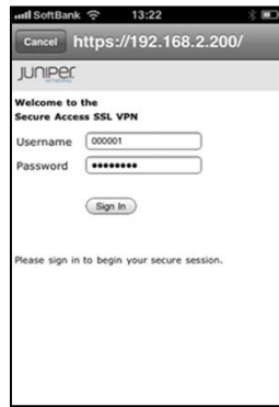
ユーザーIDとパスワードを入力