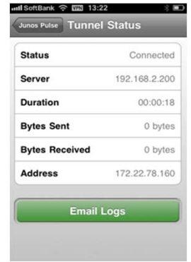
接続時のステータス